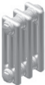
K3 Ep. 100 mm