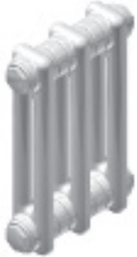
K2 Ep. 62 mm