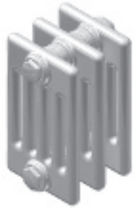
K5 Ep. 173 mm