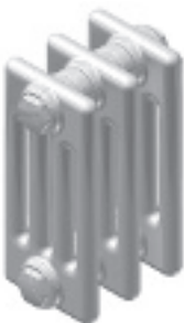
K4 Ep. 136 mm