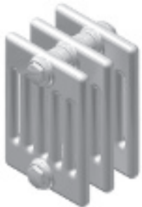
K6 Ep. 210 mm